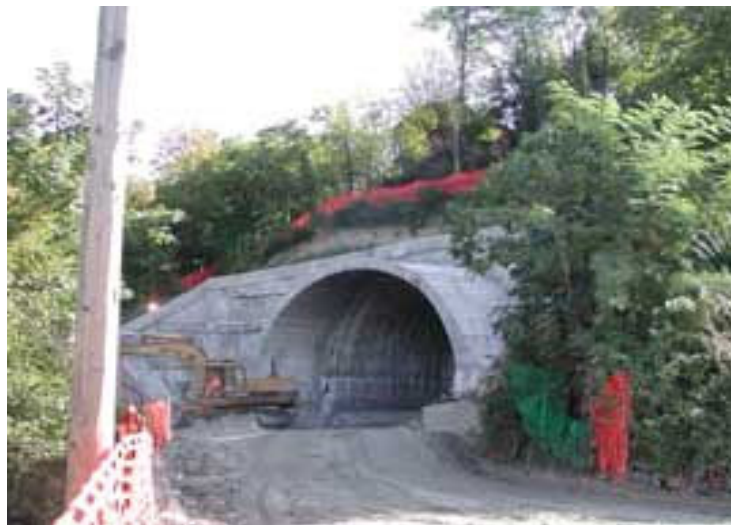
Ingresso della galleria della variante, versante di Villa d'Adda

Secondo le previsioni la Variante sarà completata entro il mese di marzo del 2007. Sono già concluse tutte le opere tecniche nei tratti esterni alla galleria e le due rotatorie, già aperte al transito. Sono in corso di completamento la realizzazione delle opere minori e il corpo stradale. La nuova arteria stradale sarà molto importante per Villa d'Adda: non solo permetterà agli abitanti una vita più tranquilla senza il pericolo e il rumore del traffico pesante, ma consentirà all'Amministrazione comunale di completare i lavori per convogliare gli scarichi fognari al depuratore di Brembate in quanto sarà creato un impianto di pompaggio nella zona del torrente Rito e il collettore principale passerà nella galleria.