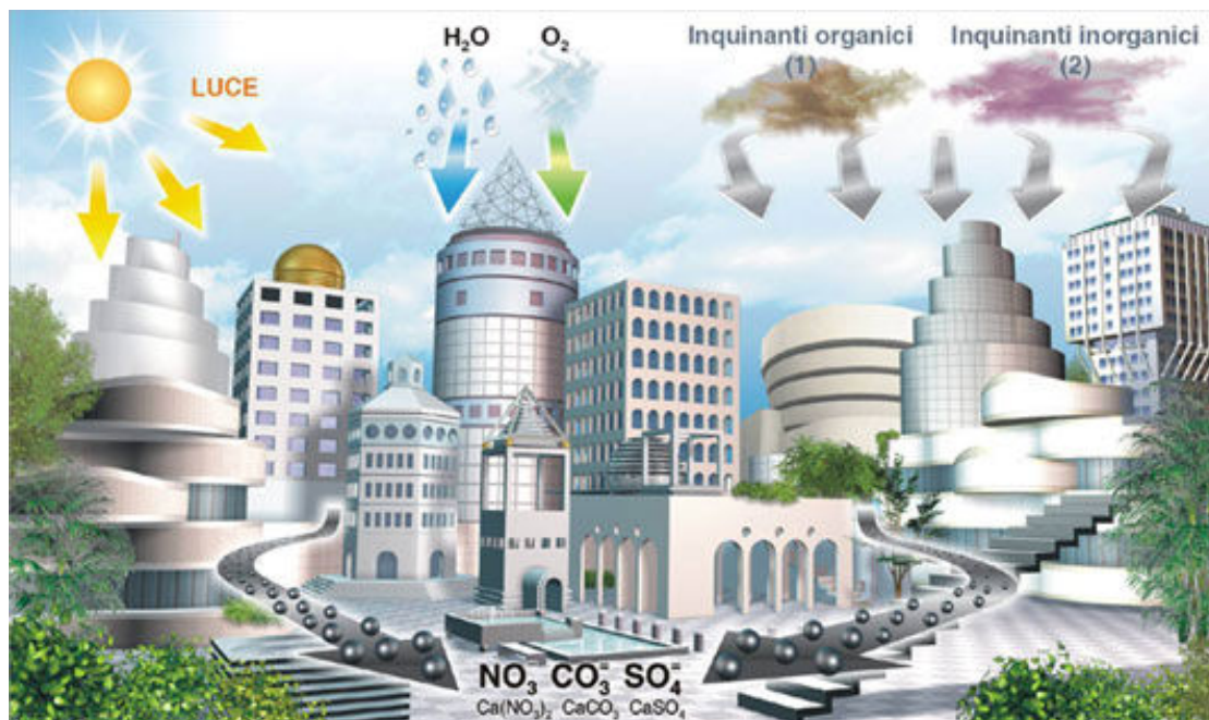
schema grafico della fotocatalisi

La particolarità di questi masselli autobloccanti è il contenere nell'impasto una particolare sostanza detta fotocatalizzatore che innesca un processo naturale, detto appunto fotocatalisi, che sfruttando l'energia luminosa favorisce la più rapida decomposizione degli inquinanti evitandone l'accumulo. La fotocatalisi contribuisce quindi in modo efficace al miglioramento della qualità della vita.