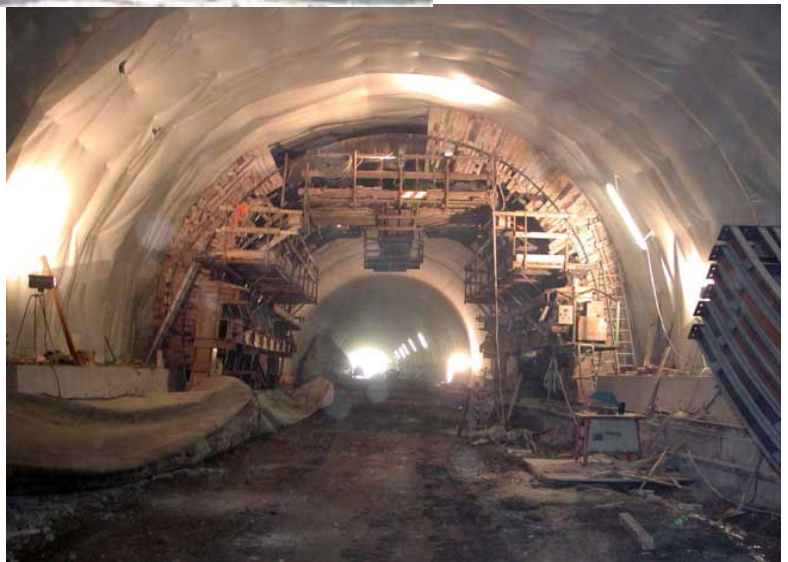
Interno della galleria stradale